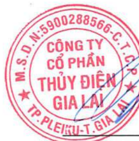
Trần Danh Bảo Giám đốc Chữ ký được ủy quyền Ngày 21 tháng 3 năm 2024

Các thuyết minh từ trang 9 đến trang 43 là một phần cấu thành báo cáo tài chính này.